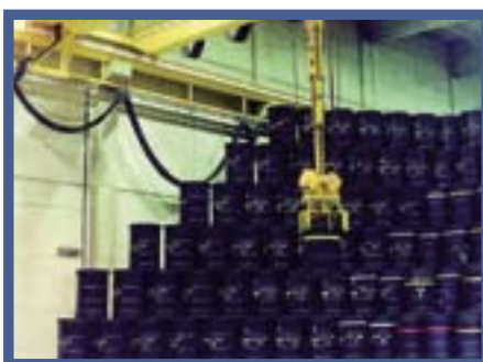
Tijdelijke opslag van radioactief afval bij Belgoprocess (Mol-Dessel)

Radioactiviteit vermindert met de tijd, maar sommige elementen in het afval blijven radioactief gedurende een periode die meerdere generaties overstijgt. Daarom moet gewerkt worden met een oplossing die gedurende deze periode bescherming biedt tegen ioniserende straling. Bij berging wordt het afval zodanig ingesloten en afgezonderd van mens en milieu dat er geen actieve tussenkomst van de toekomstige generaties meer nodig is om de bescherming voor mens en milieu over een dergelijke tijdsperiode te verzekeren.